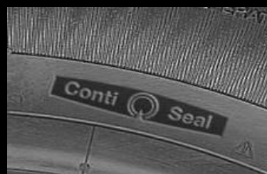
Emblema en el costado