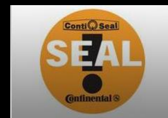
Etiqueta adherible en llanta